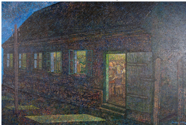
1. | Tanec v kultúrnom dome | Igranka u domu kulture