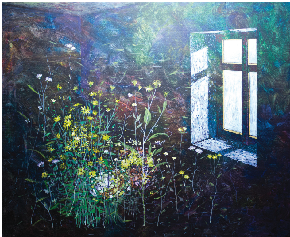
7. | Žlté kvety Žuto cveče