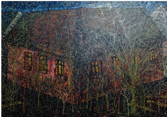
9. | Osamelý dom | Kuća na osami