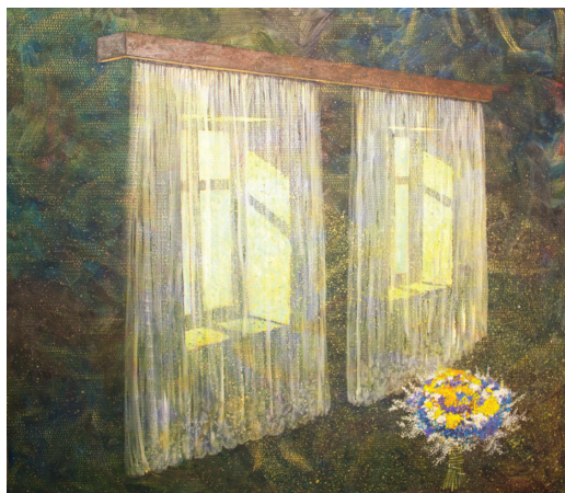
12. | Závěs | Zavesa