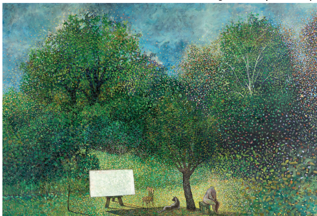
26. | V záhrade | U vrtu