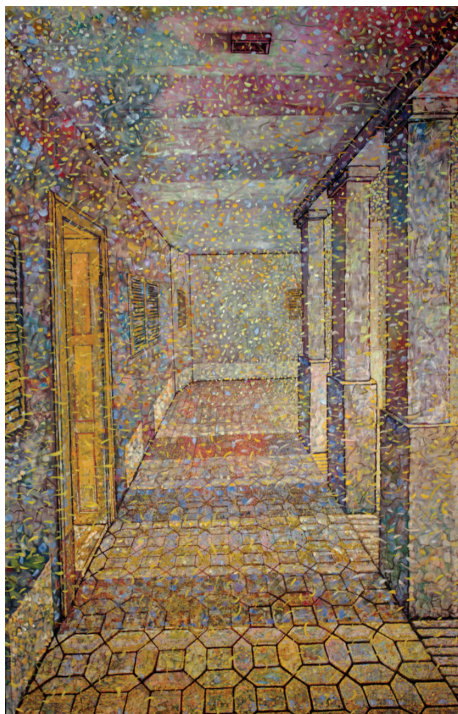
23. | Chodba Hodnik