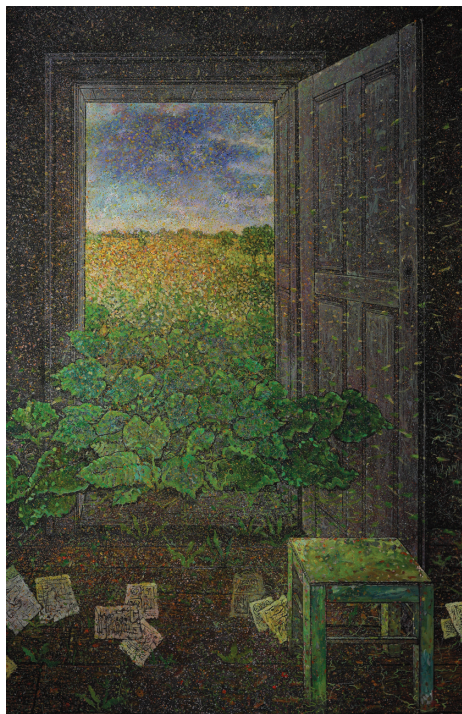
16. | Ateliér Atelje