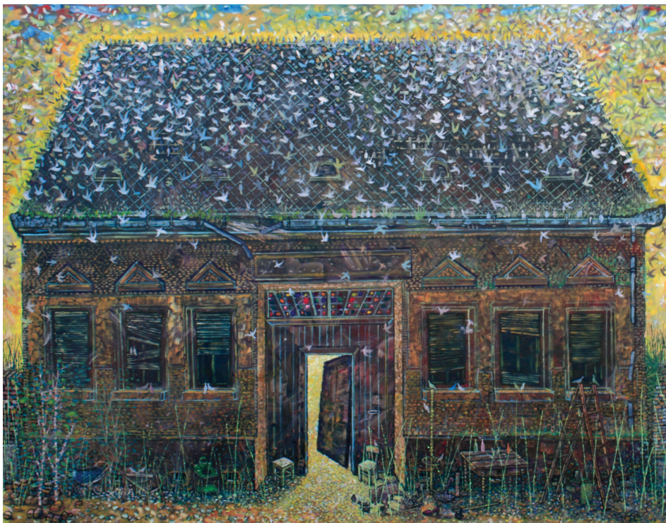
20. | Dom pre vtáky Kuća za ptice