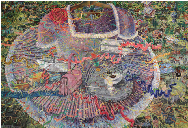
19. | Spomienky | Sečanja