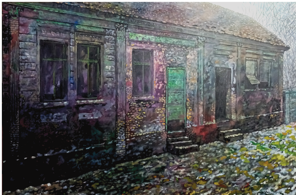
2. | Dom v M. | Kuća u M.